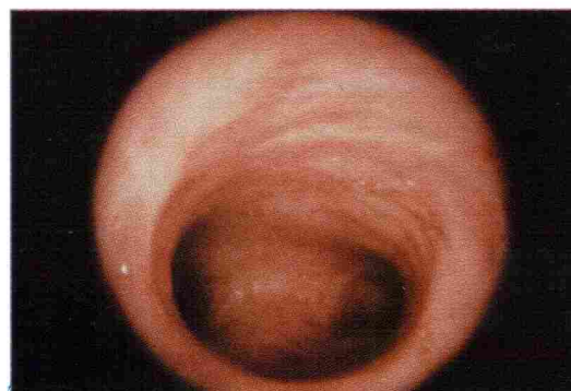
Cavité utérine normale